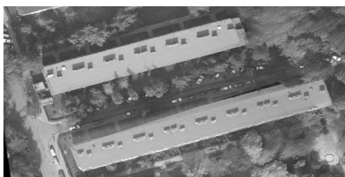
Rys. 3. Fragment ortofotomapy, wygenerowanej na podstawie zbioru punktów NMT oraz punktów NMPT z pominięciem niskiej roślinności.

W celu usunięcia efektu nierównych krawędzi, ortorektyfikacja została oparta na równoczesnym zastosowaniu modelu terenu - NMT z punktów przeklasyfikowanych na warstwę „ ground ”, oraz modelu pokrycia - NMPT z punktów przeklasyfikowanych na warstwę „ high vegetation ”, zawierającą tylko wysoką roślinność oraz budynki. Pominięte zostały punkty warstwy „ low vegetation ” (niska roślinność, samochody, itp.), co daje znaczną poprawę terenowych elementów liniowych(droga), jednak krawędzie budynków dalej są poszarpane, a korony drzew sztucznie rozmazane, co w dalszym ciągu jest dalekie od ideału. (Rys. 3).