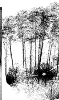
Rys. 2. Widok typu 3D.