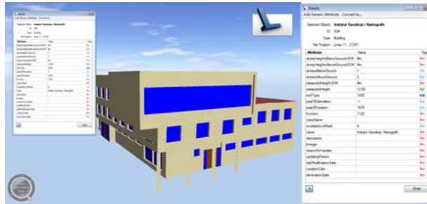
Rys. 4. Przykładowy widok z programu AutoDesk LandXplorer modelu CityGML z wyświetlonymi atrybutami zdefiniowanymi dla budynku

Powyższy zapis jest przetwarzany przez program odczytujący pliki CityGML umożliwiając przeglądanie atrybutów oraz przeszukiwanie po nich obiektów. Ta dodatkowa informacja zdefiniowana w schemacie CityGML poszerza możliwości informacyjne modelu 3D. Przykładowe okno pozwalające na przeglądanie zapisanych w strukturze danych CityGML atrybutów przedstawiono na rysunku 4.