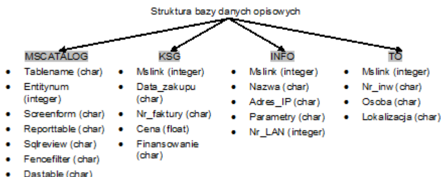
Rys. 2. Opracowana struktura bazy danych

Oprogramowanie MicroStation, którego głównym zadaniem jest modelowanie danych wektorowych ma ograniczony zakres możliwości w tworzeniu atrybutów poszczególnych tabel bazy danych. Atrybuty mogą zawierać wartości wyrażone za pomocą tekstu, liczb całkowitych i liczb zmiennoprzecinkowych. Jednocześnie w celu optymalizacji pamięci, jaką będzie zajmowała baza danych możliwe jest określenie szerokości każdej z kolumn. Zastosowany interfejs ODBC umożliwia tylko tworzenie oraz usuwanie tabel. Do wykonania edycji atrybutów potrzebny jest zewnętrzny program bazodanowy.