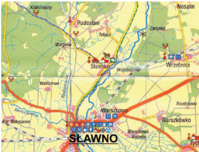
Rys. 1. Fragment mapy „Powiat sławieński”, Wyd. Region (2002).

Podstawowe przedstawienie kartograficzne mogą uzupełniać kartony. Niewątpliwie najistotniejszym dodatkiem jest plan stolicy powiatu (zamieszczany również w przy-