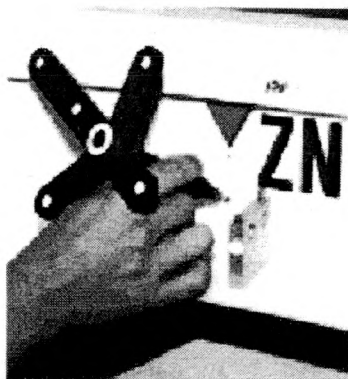
a) Leica V-STARS/M

Integralną częścią systemu jest precyzyjny taster – specjalny wodzik ( manual probe ) (Rys. 2) do stykowego definiowania mierzonych punktów obiektu. Taster posiada co najmniej 3 punkty referencyjne. System wyposażony jest również w skalibrowany wzorec referencyjny – pole testowe. Jest to przenośna, zazwyczaj przestrzenna konstrukcja z sygnalizowanymi punktami o znanych współrzędnych w układzie lokalnym. Kształt i wymiary tastera oraz wzorca referencyjnego dobierane są do geometrycznych warunków opracowania zdjęć.