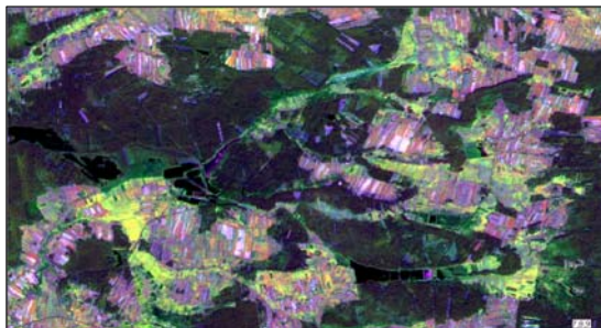
Rys. 1. Trzy kompozycje barwne dwuczaskowego zobrazenia Lansat ETM+ dla okolic Bełchatowa

R'G'B' _{FCC} = IHSTORGB [ETM8(2001-05-01), Hue [RGB _{FCC} ], Saturation [RGB _{FCC} ]]