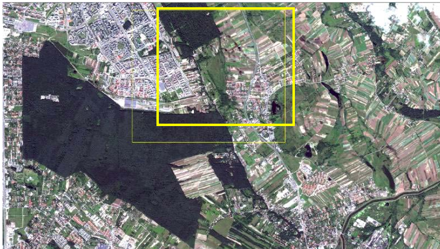
Rys. 1. Obraz satelitarny WorldView-2 zarejestrowany dla obszaru Warszawy w dniu 4 sierpnia 2011 r. oraz obszar poddany analizie

Głównym celem niniejszej pracy było określenie przydatności poszczególnych metod integracji danych obrazowych w odniesieniu do obrazów, rejestrowanych przez instrumenty satelity WorldView-2, które charakteryzują się większą – niż w przypadku innych wysokorozdzielczych systemów satelitarnych – liczbą pozyskiwanych kanałów spektralnych oraz szerszy zakres rejestrowanego promieniowania elektromagnetycznego.