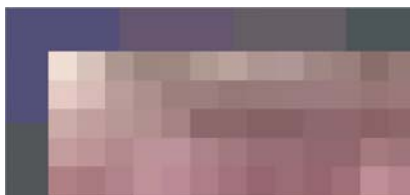
Rys. 2. Obraz wielospektralny (pod spodem) i obraz po integracji obrazu panchromatycznego oraz wielospektralnego, uzyskany za pomocą oprogramowania ERDAS Imagine (na wierzchu)

Analizując uzyskany wynik można stwierdzić, iż program ERDAS Imagine jako początek nowo tworzonego obrazu przyjmuje środek piksela obrazu wielospektralnego. Dla przeciętnego użytkownika jest to mało istotna kwestia, nie mniej jednak tego rodzaju podejście powoduje konieczność ponownego próbkowania obrazu panchromatycznego przed dokonaniem integracji PAN i MS i wpływa na dalsze przetworzenia i analizy. Aby tego uniknąć obraz wielospektralny został dostosowany do wielkości matrycy obrazu panchromatycznego (piksel został podzielony na piksele o wymiarach 0.5 \times 0.5 m). Zabieg ten wyeliminował efekt zmniejszenia wymiarów obrazu, będącego wynikiem łączenia obrazów PAN i MS.