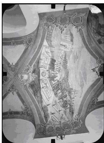
jedno z pomiarowych zdjęć panchromatycznych stereogramu

Stereogramy wykonano z wykorzystaniem kamery UMK 10/1318 i błon negatywowych Fomapan 100 (przykład zdjęcia na rysunku 2). Kierunek bazy stereogramu zależał od wielkości kolebki, z reguły baza była równoległa lub prostopadła do tworzących powierzchni walcowej. Stosunek bazowy wynosił średnio 1:8. Ze względu na wielkość przeszć sklepienia zdjęcia wykonywane były bezpośrednio z poziomu posadzki. Dla zapewnienia poprawnych warunków ekspozycji wykorzystano dwie sprzężone studyjne lampy błyskowe Bowens o mocy 1000W. Zapewniły one możliwość wykorzystania dużej przysłony (22) dla uzyskania głębi ostrości w zakresie od 3 m do 5.5 m (głębokość kolebki).