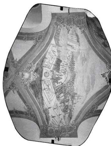
po rozwinięciu metodą wielomianową