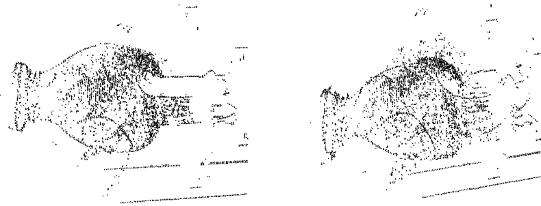
Rys. 3. Szkic modelu wytworzonego z zastosowaniem obrotowej tarczy

Po wstępnym wygenerowaniu chmury punktów (rys. 4a) nastąpiło odfiltrowanie punktów odstających od reszty i stworzenie regularnej siatki (rys. 4b).