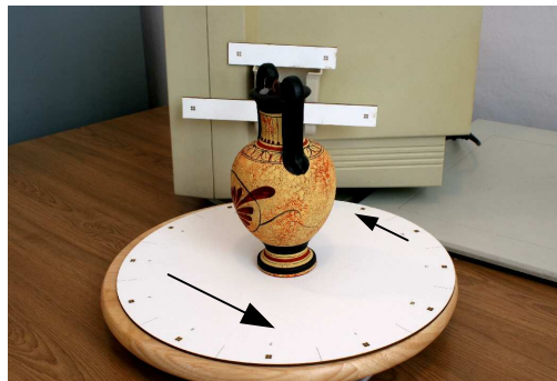
Rys. 1. Ustawienie obiektu na obrotowej platformie z układem punktów referencyjnych; oś Z układu współrzędnych skierowana była prostopadle do tarczy

Pierwszy z nich, stosowany często w tego typu zadaniach, polegał na postawieniu amfory na obrotowej tarczy (Pavelka et al. , 2003), (Yılmaz et al. , 2004). Tarcza ta miała naniesioną sygnalizację punktów referencyjnych na obwodzie (rys. 1). Stanowisko kamery było w takiej konfiguracji stałe, a amfora razem z tarczą była obracana do wykonania poszczególnych zdjęć, co zmieniało orientację kamery względem układu osnowy i obiektu.